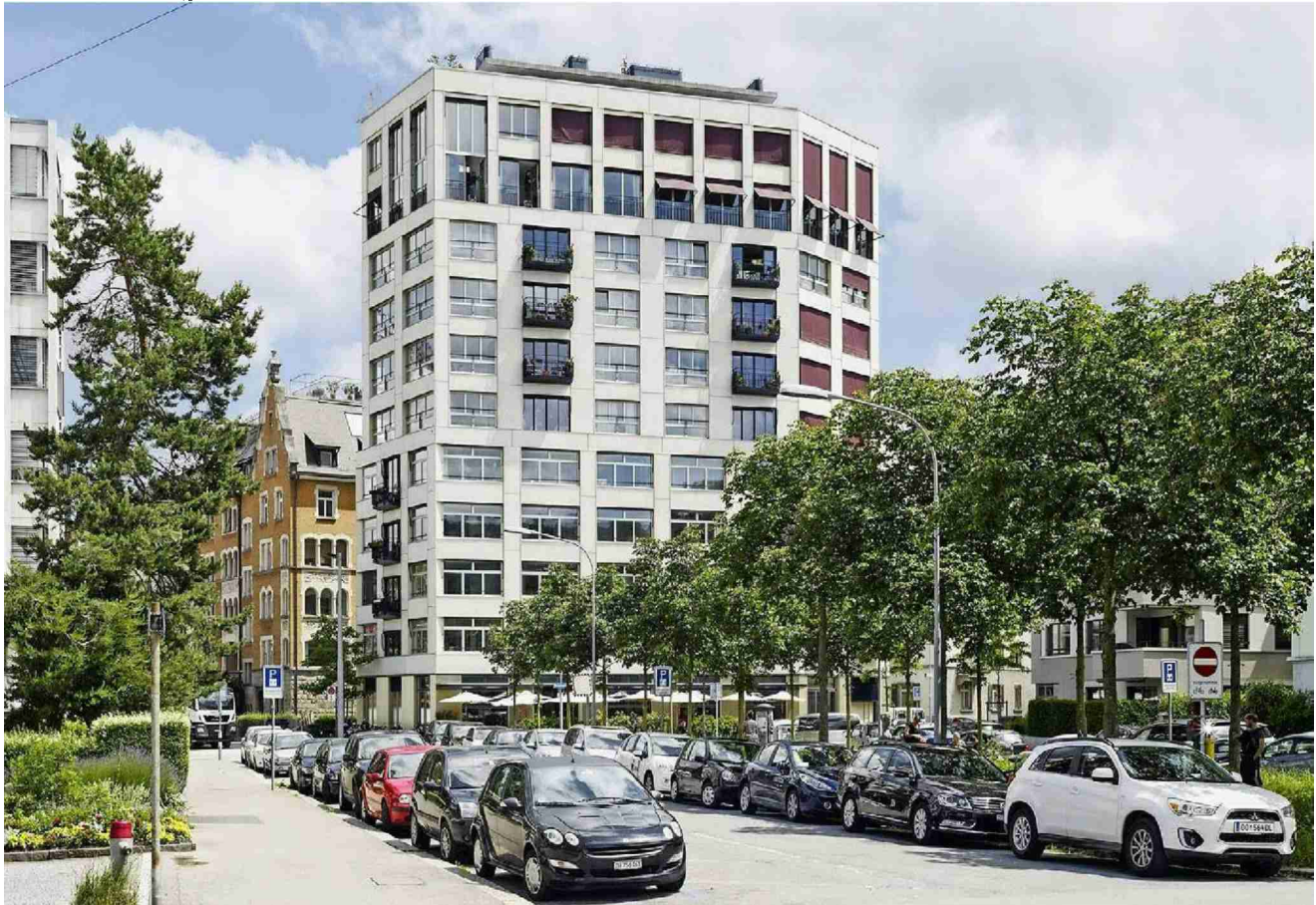
Das Hohe Haus West sei mit viel Sorgfalt in den städtebaulichen Kontext eingefügt worden, befand die Jury.

Gute Gebäude müssen der Öffentlichkeit Raum bieten. Das erfüllen etwa das Hohe Haus West oder der Gewerbebau Noerd - und auch der Publikumsliebbling.