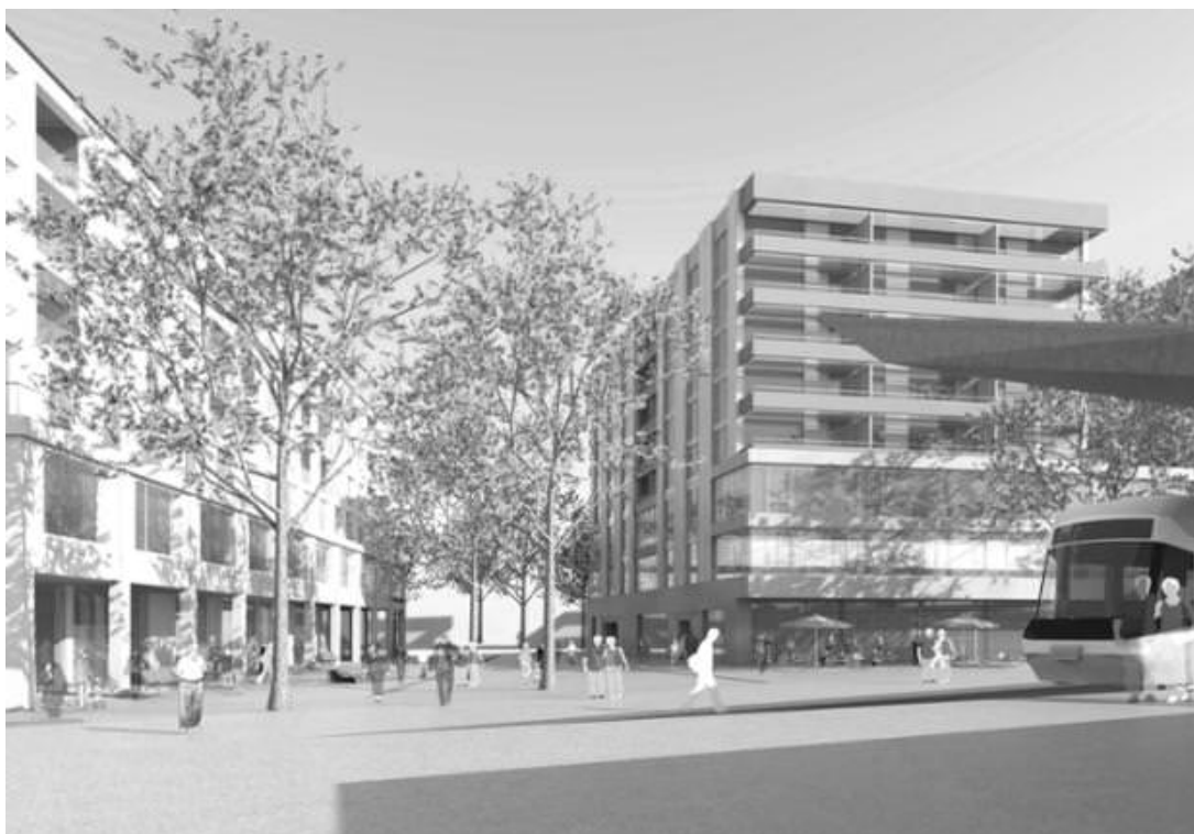
Visualisierung der geplanten Siedlung beim Bahnhof Dübendorf.

(sda) Auf dem städtischen Grundstück « Hoffnig » in Dübendorf direkt beim Bahnhof Stettbach sind zwei Gebäude mit 283 Wohnungen geplant. Der Stadtrat Dübendorf hat den privaten Gestaltungsplan und die Baurechtsverträge verabschiedet, wie er am Mittwoch bekanntgab. Entscheiden muss der Gemeinderat. Das hervorragend erschlossene Areal sei das zentrale Bindeglied zwischen dem Bahnhof und dem neu entstehenden städtischen Quartier Hochbord, schreibt der Stadtrat in seiner Mitteilung.